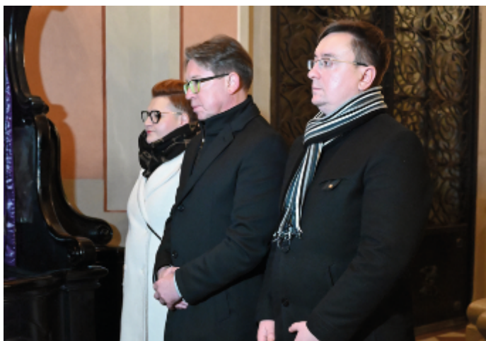
Delegacja Muzeum Regionalnego w Brzozowie