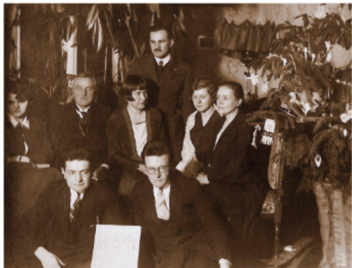
Senator Stanisław Biały w otoczeniu rodziny

Z jego inicjatywy w latach 1902–1905 przeprowadzono gruntowną renowację świątyni wraz z dzwonicą. Odnowiono ołtarz główny, wymieniono posadzkę na mozaikową, zmodernizowano organy, wykonano nowe ogrodzenie wokół kościoła.