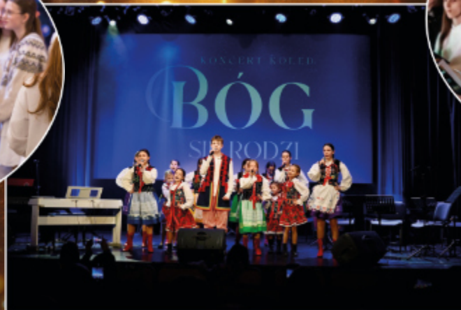
Brzozowski Dom Kultury