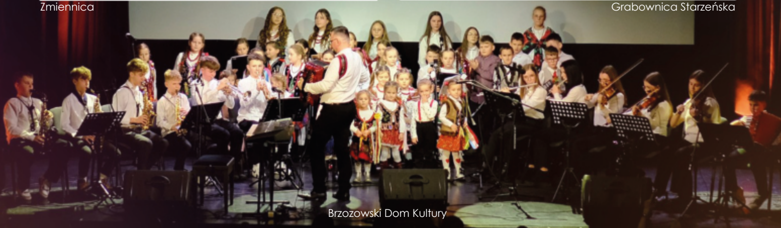
Brzozowski Dom Kultury