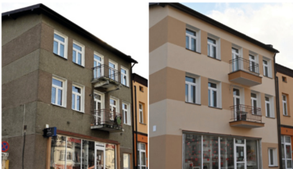
Budynek przed i po termomodernizacji

Gmina Brzozów z sukcesem zakończyła termomodernizację budynku wielorodzinnego przy ul. Mickiewicza 3, realizowaną w ramach programu „Ciepłe Mieszkanie”. Projekt został dofinansowany ze środków Wojewódzkiego Funduszu Ochrony Środowiska i Gospodarki Wodnej w Rzeszowie, a całkowita wartość inwestycji wyniosła ponad 300 tys. zł, z czego dofinansowanie WFOŚiGW wyniosło około 140 tys. zł.