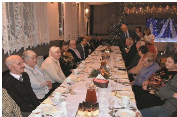
Przysietnica (20 stycznia)