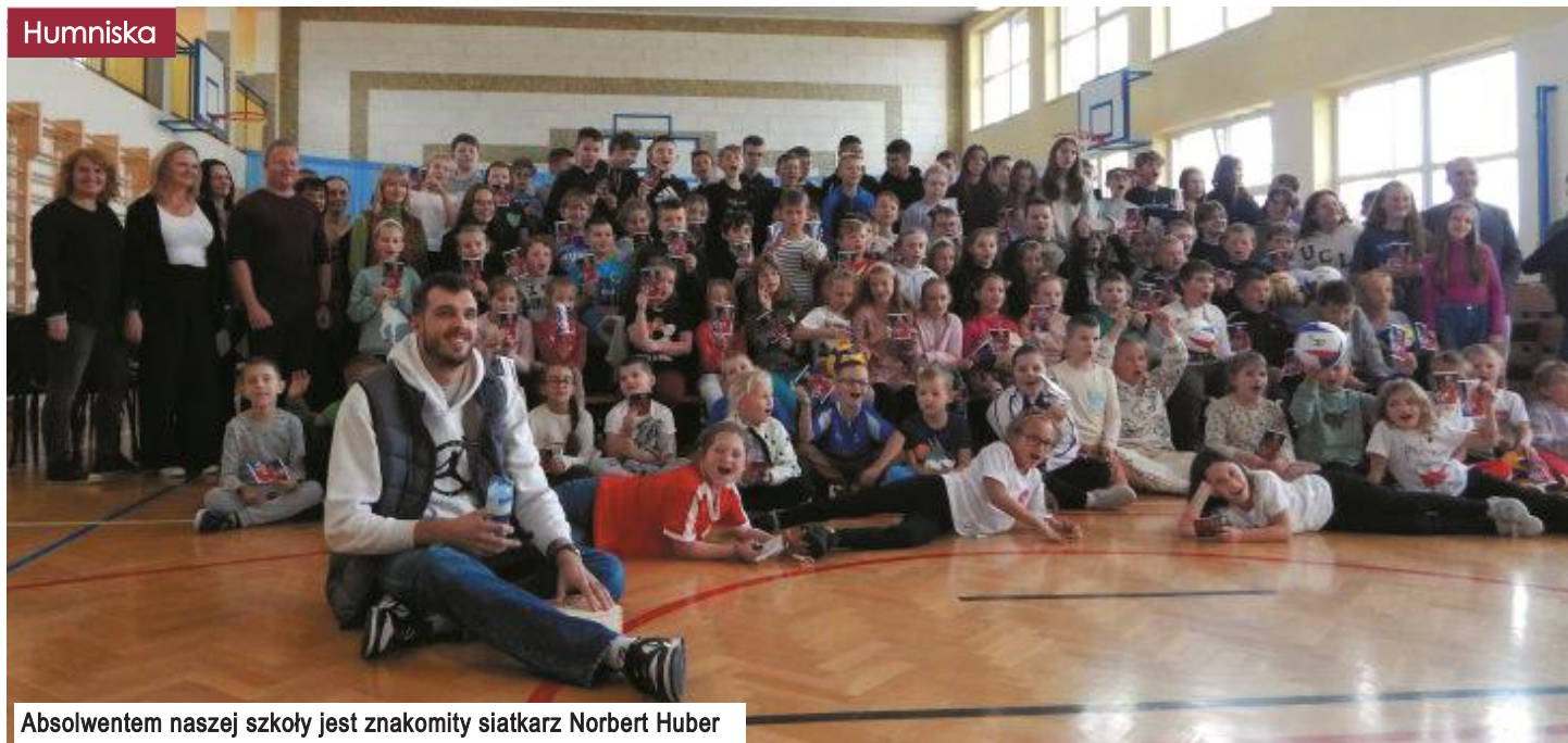
Absolwentem naszej szkoły jest znakomity siatkarz Norbert Huber