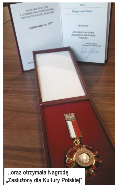
...oraz otrzymała Nagrodę „Zasłużony dla Kultury Polskiej”