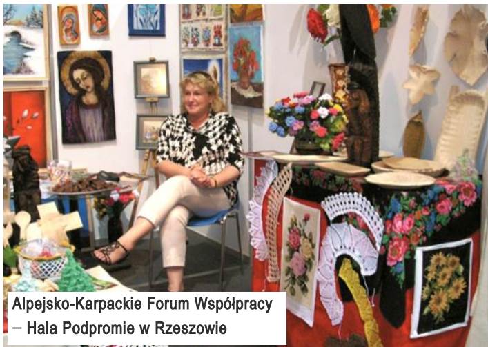
Alpejsko-Karpackie Forum Współpracy – Hala Podpromie w Rzeszowie

lub zagrożonymi wykluczeniem, w określonym czasie.