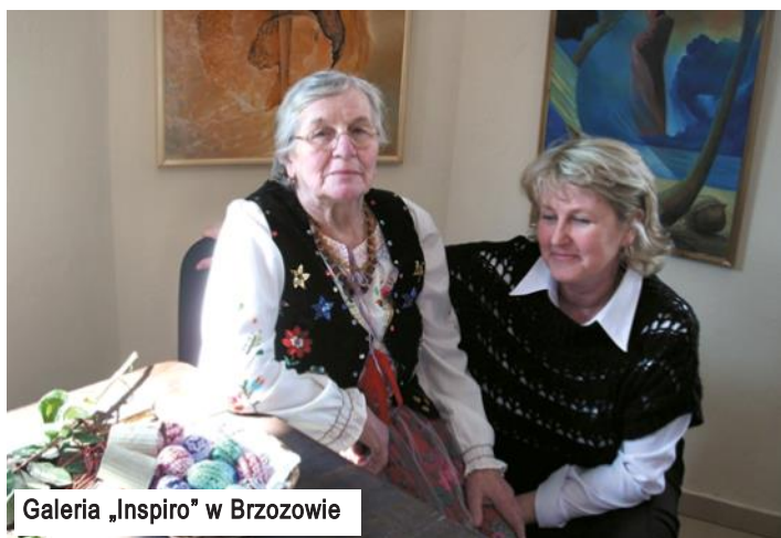
Galeria „Inspiro” w Brzozowie