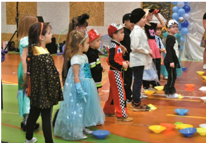
Muzeum Regionalne w Brzozowie

wszystkie dzieci czekało mnóstwo atrakcji. Zabawa z animatorkami, malowanie twarzy, zamek z piętczkami oraz fotobudka 360, loteria fantowa oraz stoisko policyjne. Radości dzieciom dostarczyły również maskotki „Mrówka” Brzozów, ZSE Brzozów oraz KPP w Brzozowie, które częstowały słodkościami i zachęcały do wspólnej zabawy. Atrakcją wydarzenia był także wybór Królowej i Króla balu. O kącik słodkości oraz wystrój sali zadbali Rodzice uczniów na czele z Radą Rodziców SP w Brzozowie.