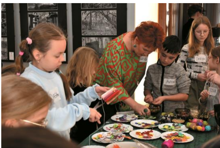
Miejska Biblioteka Publiczna w Brzozowie