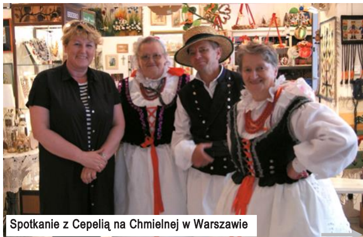
Spotkanie z Cepelią na Chmielnej w Warszawie

Do swojej pracy społecznej podchodzi z sercem, czego efekty zostały już parokrotnie nagrodzone m.in. przez Zarząd Województwa Podkarpackiego „Za