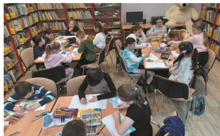
Fundacja Pomocy Dzieciom im. St. Bieńczyk