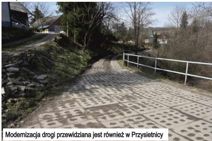
Modernizacja drogi przewidziana jest również w Przysietnicy

W następnej kolejności realizowane będzie zadanie polegające na zagospodarowaniu i uporządkowaniu terenu na działkach nr 1811 i 1806/2 znajdujących się za budynkiem Koła Gospodyń Wiejskich w Grabownicy Starzeńskiej. Poza pracami porządkowymi, na pobliskim placu wymieniona zostanie również nawierzchnia asfaltowa. Na to zadanie przeznaczonych zostanie 81 tys. zł.