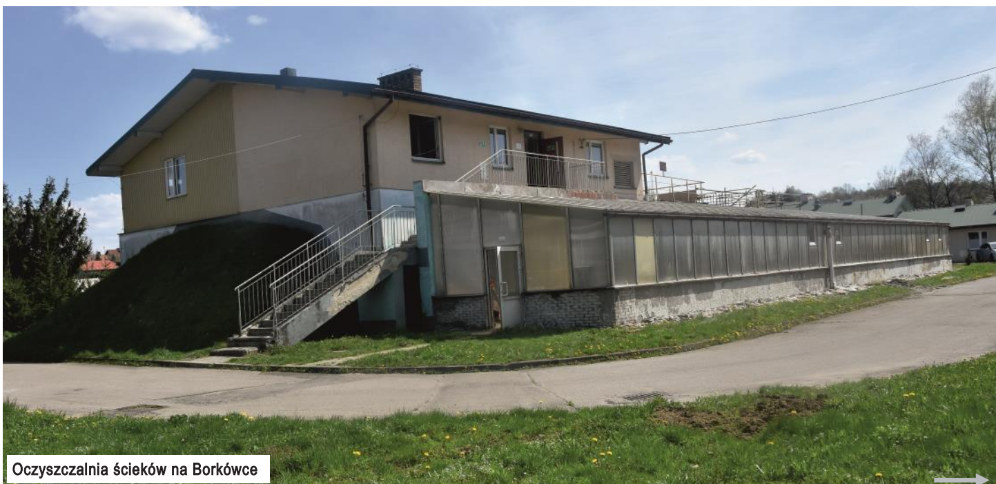
Oczyszczalnia ścieków na Borkówce

– Nie chcieliśmy podejmować działań wbrew woli mieszkańców, dlatego zrezygnowaliśmy wówczas z tego przedsięwzięcia – wyjaśnia burmistrz.