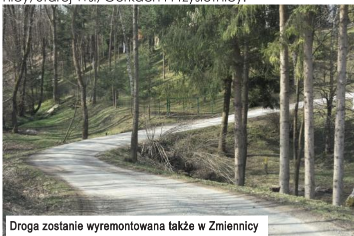
Droga zostanie wyremontowana także w Zmiennicy

Pierwsze roboty drogowe rozpoczęły się w kwietniu, jedna została już zrealizowana, a pozostałe będą trwały do października. Remonty dróg polegać będą na wymianie starej nawierzchni – głównie żwirowej lub z płyt żelbetonowych na asfaltową. Prace prowadzone będą w Grabownicy Starzeńskiej, Humniskach, Zmiennicy, Starej Wsi, Górkach i Przysietnicy.