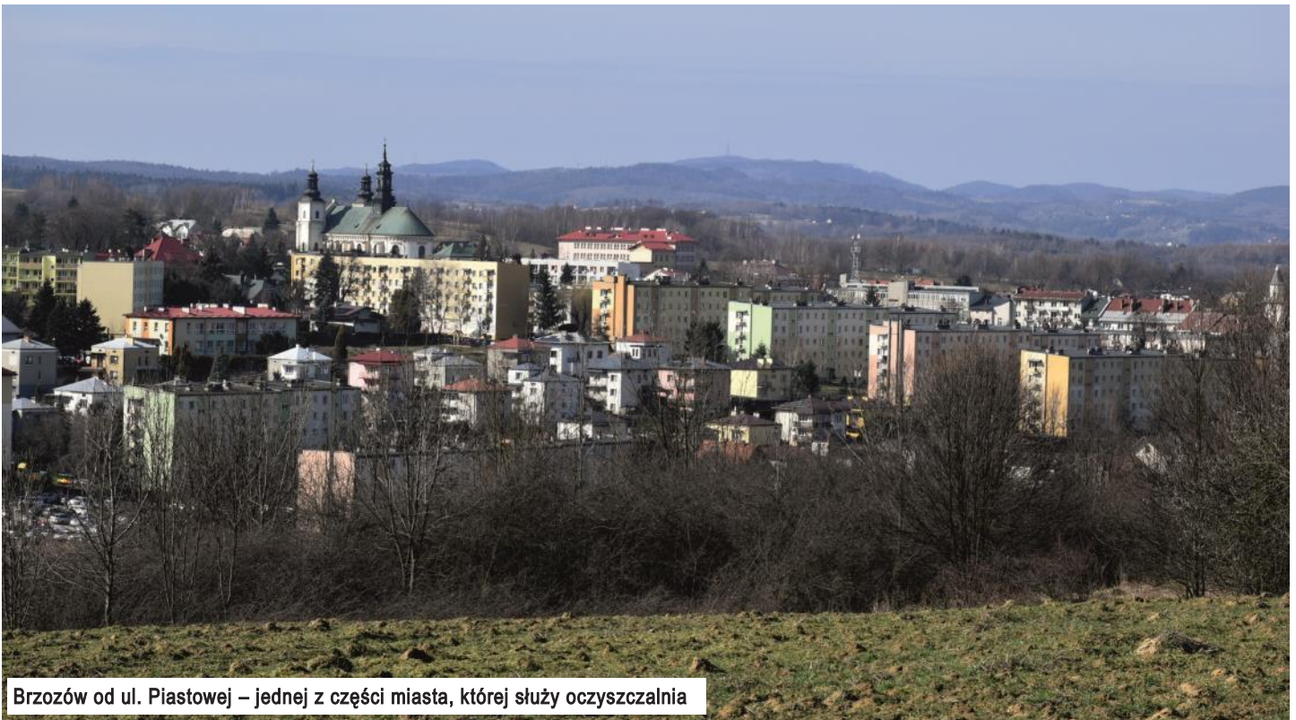
Brzozów od ul. Piastowej – jednej z części miasta, której służy oczyszczalnia

Środki finansowe pochodzące z Urzędu Miejskiego