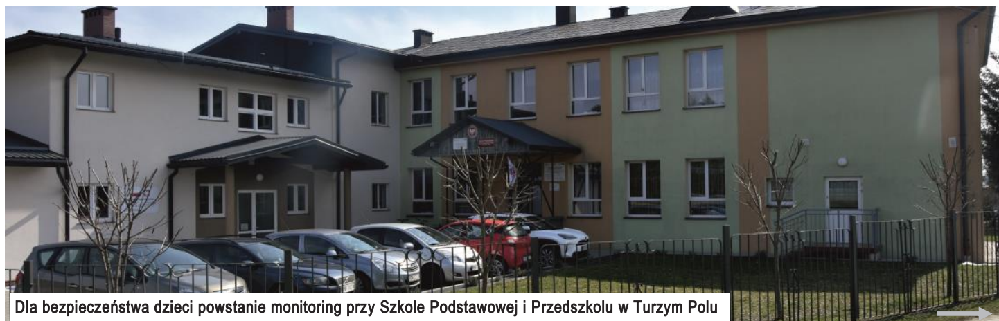
Dla bezpieczeństwa dzieci powstanie monitoring przy Szkole Podstawowej i Przedszkolu w Turzym Polu

Droga asfaltowa powstanie również w okolicy małej obwodnicy w Woli Góreckiej. Na jej remont przeznaczonych zostanie około 38 tys. zł. Podobna modernizacja przewidziana jest także w Przysietnicy w okolicach leśniczówki. Koszt jej wyniesie prawie 53 tys. zł.