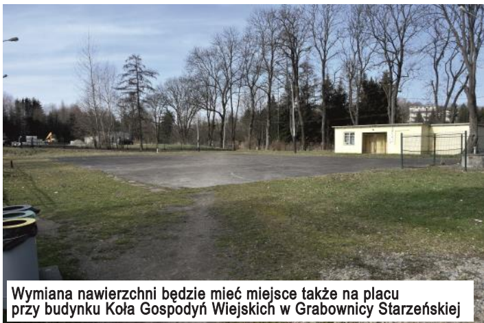
Wymiana nawierzchni będzie mieć miejsce także na placu przy budynku Koła Gospodyń Wiejskich w Grabownicy Starzeńskiej

Inne zadania, o które wnioskowali mieszkańcy sołectw, dotyczą wykonania monitoringu przy Szkole Podstawowej i Przedszkolu w Turzym Polu. Koszt tego przedsięwzięcia szacowany jest na 13 tys. zł. W okolicy przedszkola powstanie także siłownia zewnętrzna, której realizacja wyceniona została na kwotę 40 tys. zł.